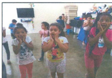
Dinâmica "Foto do momento"