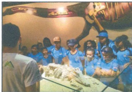
Museu dos dinossauros - Uberaba