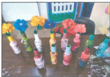
Pintura e decoupage na garrafa de vidro