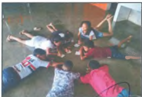
Atividade causas e conseqüências