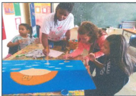
Pintura da história A ilha dos sentimentos