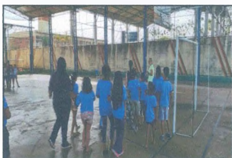
Visita escola Fausto Alexandre