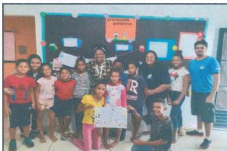
Dia Consciência Negra