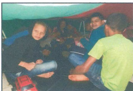
Recreação livre – brincadeira “Cabaninha”