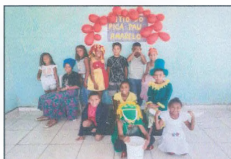
Apresentação Teatro Sítio do Pica Pau Amarelo