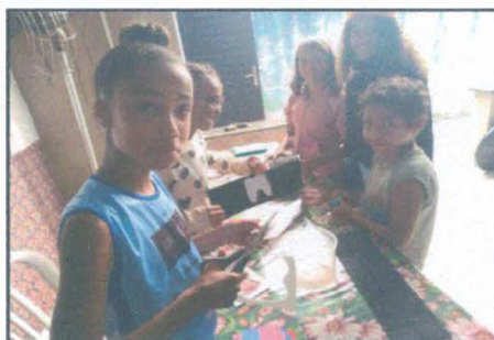
Confecção kit higiene