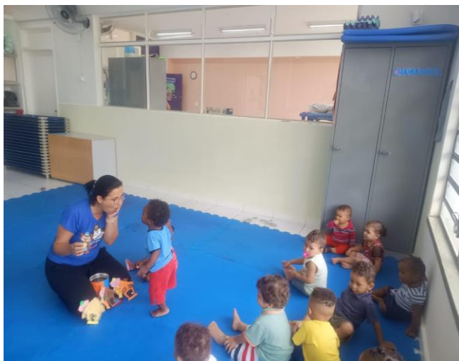
Atividade: Mão sensorial