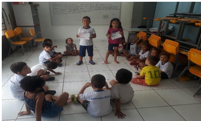
Atividade: Bom ou ruim?