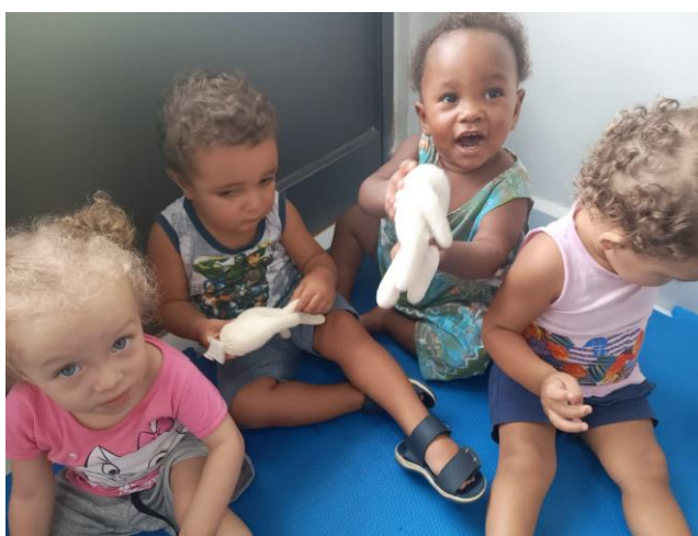
Atividade: É igual ou diferente?