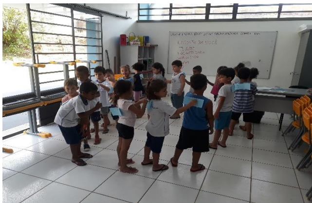
Atividade: Recebendo elogios