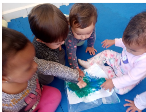
Atividade: a boca do sapo