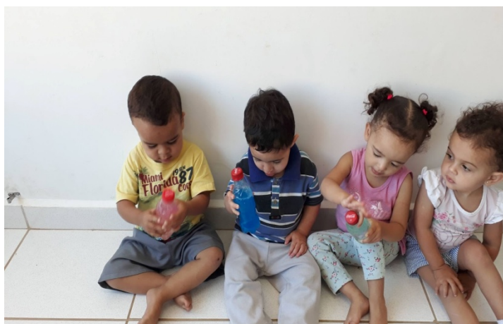
Atividade: história da serpente