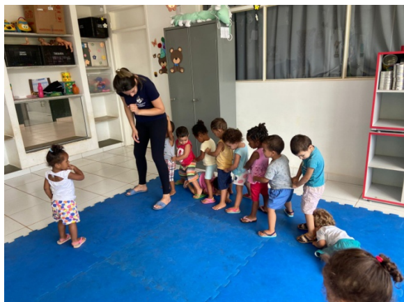
Atividade: lençol com bolinhas